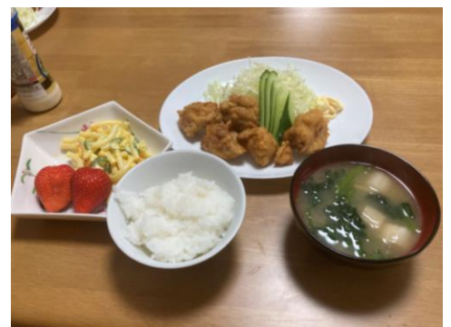
食事は毎食手作りを提供いたします